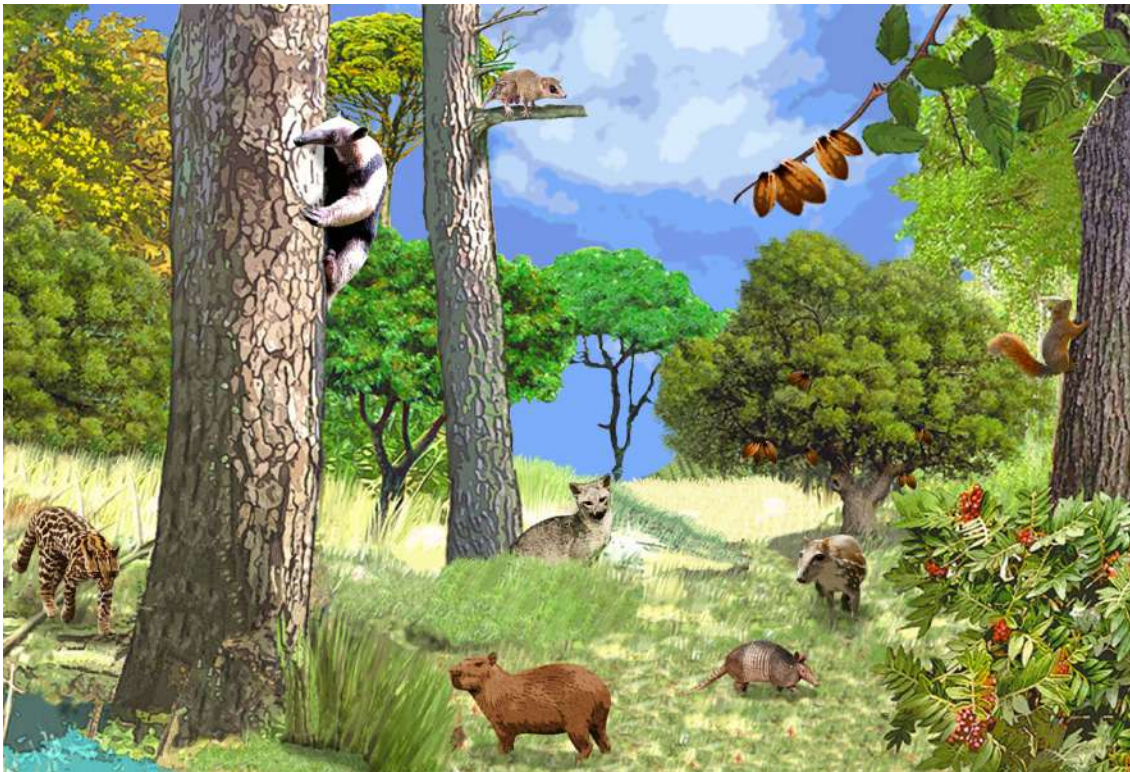
Figura 3. Representación del entorno estudiado en la Granja Yariguíes, mostrando algunas de las especies registradas. De izquierda a derecha: Ocelote ( Leopardus pardalis ; carnívoro terrestre nocturno), Tamandúa ( Tamandua tetradactyla ; insectívoro arbóreo nocturno), Marmosa ( Marmosa robinsoni ; omnívoro arbóreo nocturno), Chigüiro ( Hydrochoerus hydrochaeris ; herbívoro acuático nocturno), Zorro perro ( Cerdocyon thous ; omnívoro terrestre nocturno), Armadillo ( Dasybus novemcinctus ; insectívoro terrestre nocturno), Guagua ( Cuniculus paca ; frugívoro terrestre nocturno), Ardilla de cola roja ( Notosciurus granatensis ; frugívoro arbóreo diurno).

cional sobre insectos que afectan las plantas; mientras que, los armadillos al ser semifosoriales airean y remueven el suelo al hacer excavaciones continuas en busca de alimento o elaboración de madrigueras, lo que permite la aireación y remoción del suelo evitando la compactación (Abba et al, 2015; Bilenca et al, 2017; Rumiz, 2010). De otro lado, animales como tigrillos (carnívoros), zorros, mapaches y tayras (omnívoros), pueden estar influenciando las poblaciones de pequeños mamíferos que pueden ejercer daños en los cultivos (Nagy-Reis et al, 2019) o que pueden afectar el ecosistema si sus poblaciones aumentan considerablemente, por ejemplo, consumiendo semillas y plántulas que podrían perjudicar la dispersión y por ende, la composición del bosque (Rojas-Robles, Stiles, y Muñoz-Saba, 2012). Igualmente, herbívoros como el chigüiro y la guagua se alimentan sobre la